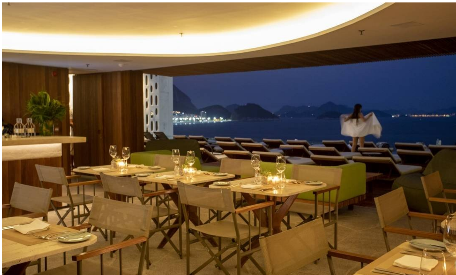
O salão do restaurante, de frente para o mar e ao lado na piscina

“Criei um menu com a cara da cidade. Quis destacar o espírito do carioca, cheio de bossa”, conta ele, que colocou no cardápio opções bem frescas como a entrada que combina vieiras e mexilhões grelhados acompanhado por farofa de mandioca com lardo, aspargos e caviar e ainda espaguete de pupunha com spirulina. “Adoro desenvolver receitas com a personalidade do lugar. O Emile é um francês que mora no Rio há anos, ama praia, um artista. Por isso possui cozinha francesa contemporânea e utiliza os melhores ingredientes brasileiros. No Rooftop, faço uma cozinha um pouco mais ousada, com sabores e cores marcantes. As minhas criações têm sempre uma combinação de texturas e cores”, explica.