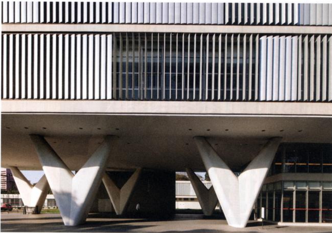
O Museu de Arte Contemporânea da USP ocupa um prédio projetado pelo arquiteto Oscar Niemeyer no complexo do Parque Ibirapuera; acima, o Real Gabinete Português de Leitura, no Rio, que tem paredes repletas de livros e adornos e, no alto, uma claraboia para filtrar a luz