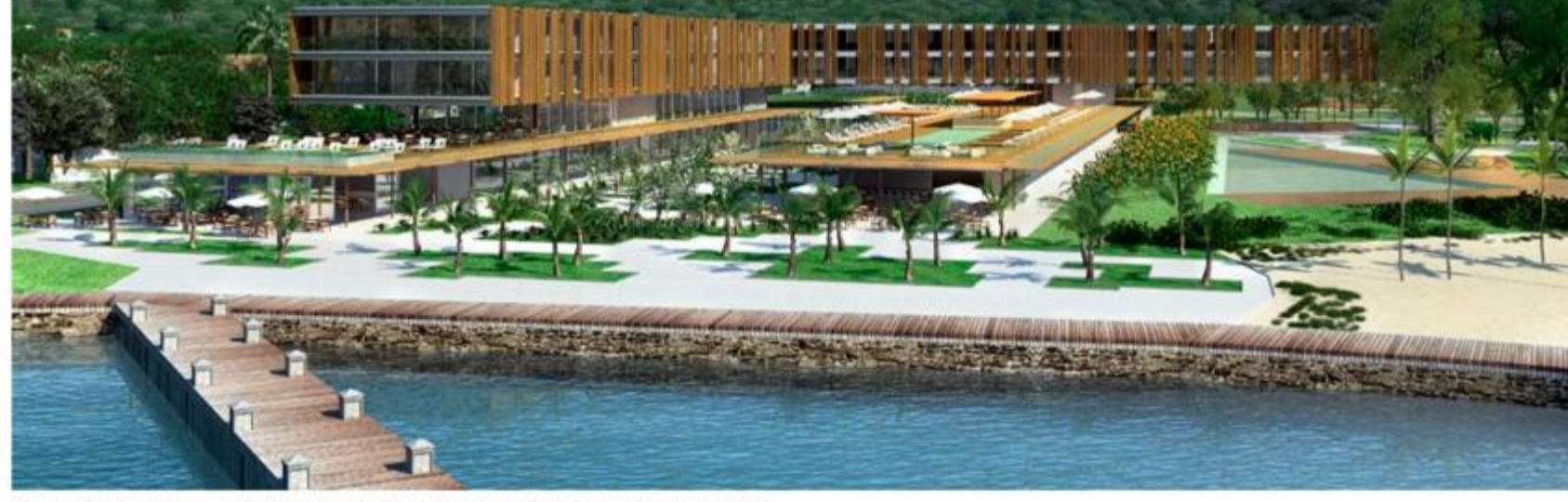
Projeção de como será a área da piscina do novo hotel Fasano Angra dos Reis