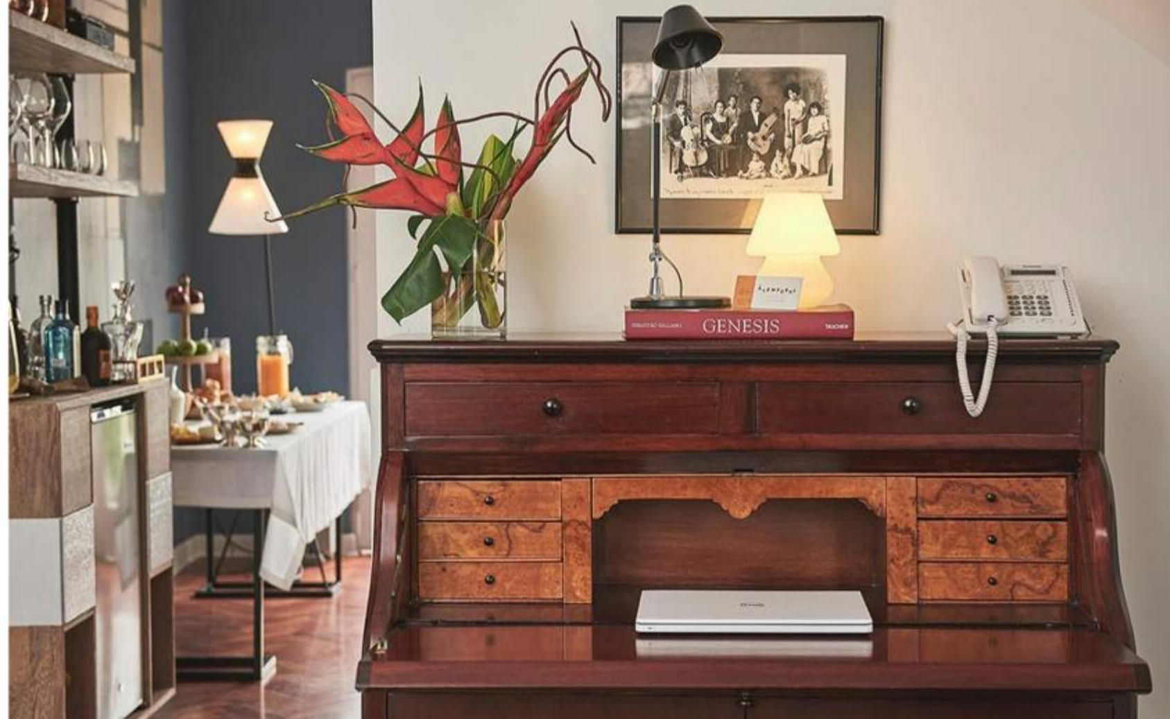
Vista de salão do hotel Atemporal, em Lima

O hotel ocupa uma residência dos anos 1940 no bairro de Miraflores, em Lima. A estética do local, concebido para imitar a casa de um fotógrafo viajado, mistura design clássico, mobília atual, artefatos peruanos e arte moderna.