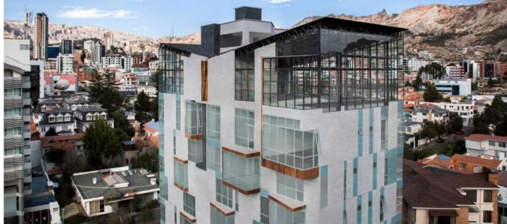
Projeção do prédio do Atix Hotel, em La Paz

O Atix está dando à Bolívia um gostinho de alto estilo. Projetada pelo arquiteto Stuart Narofsky, a estrutura de oito andares em forma de paralelogramo e erigida com madeira, vidro e pedra comanche (nativa da área), fica no bairro de Calacoto, uma região rica de La Paz.