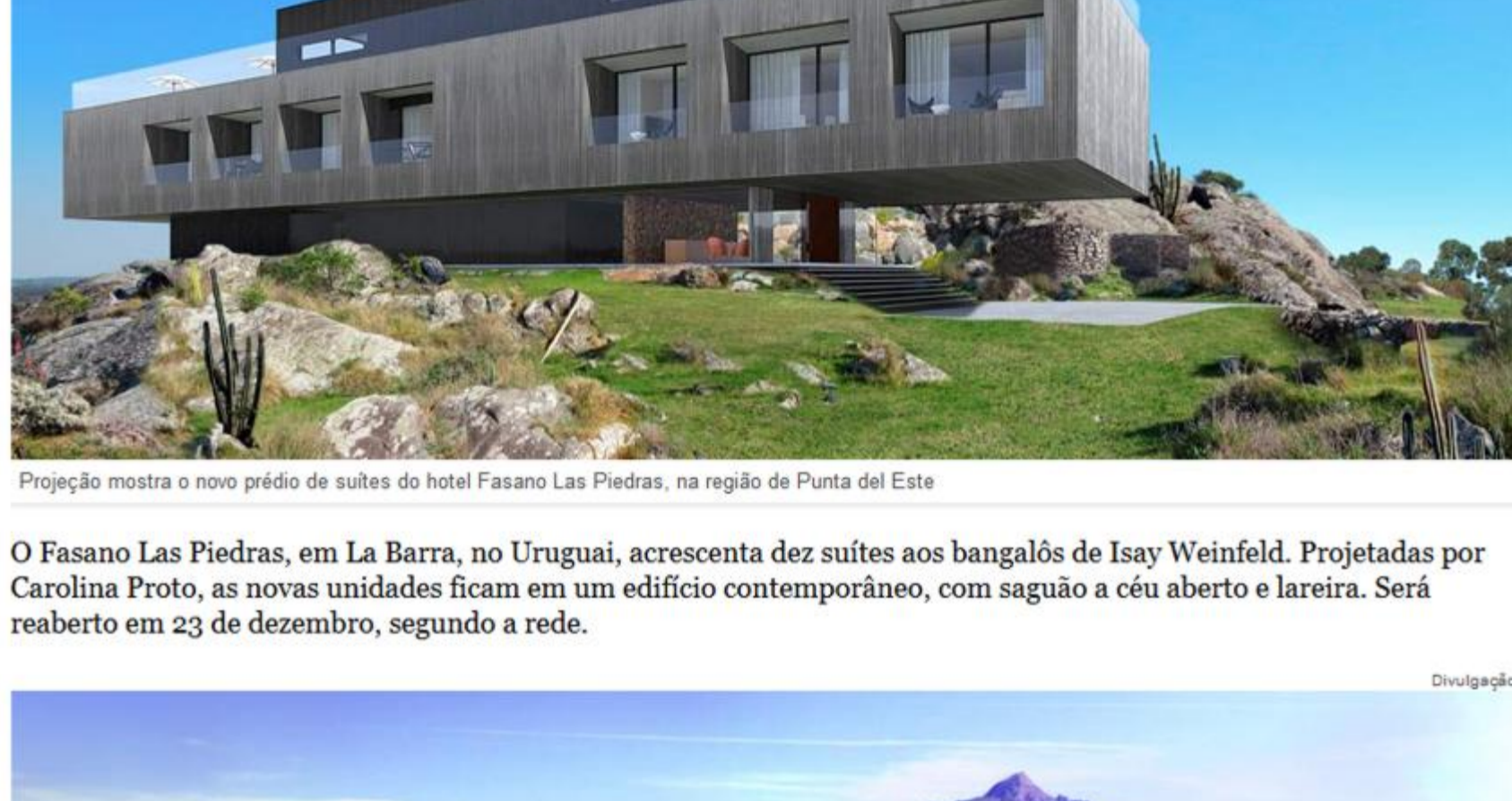
Projeção mostra o novo prédio de suítes do hotel Fasano Las Piedras, na região de Punta del Este

O Fasano Las Piedras, em La Barra, no Uruguai, acrescenta dez suítes aos bangalôs de Isay Weinfeld. Projetadas por Carolina Proto, as novas unidades ficam em um edifício contemporâneo, com saguão a céu aberto e lareira. Será reaberto em 23 de dezembro, segundo a rede.