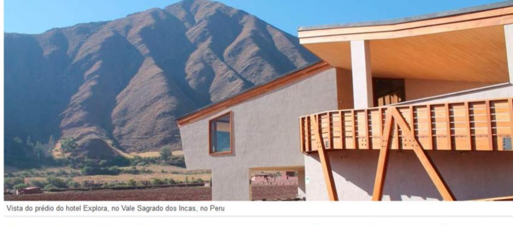
Vista do prédio do hotel Explora, no Vale Sagrado dos Incas, no Peru

O Explora Valle Sagrado foi inaugurado neste mês no Vale Sagrado dos Incas. Construídos em uma "hacienda" remota, cercada de plantações de milho nas encostas, os 50 quartos desse hotel sustentável têm vista para o altiplano andino.