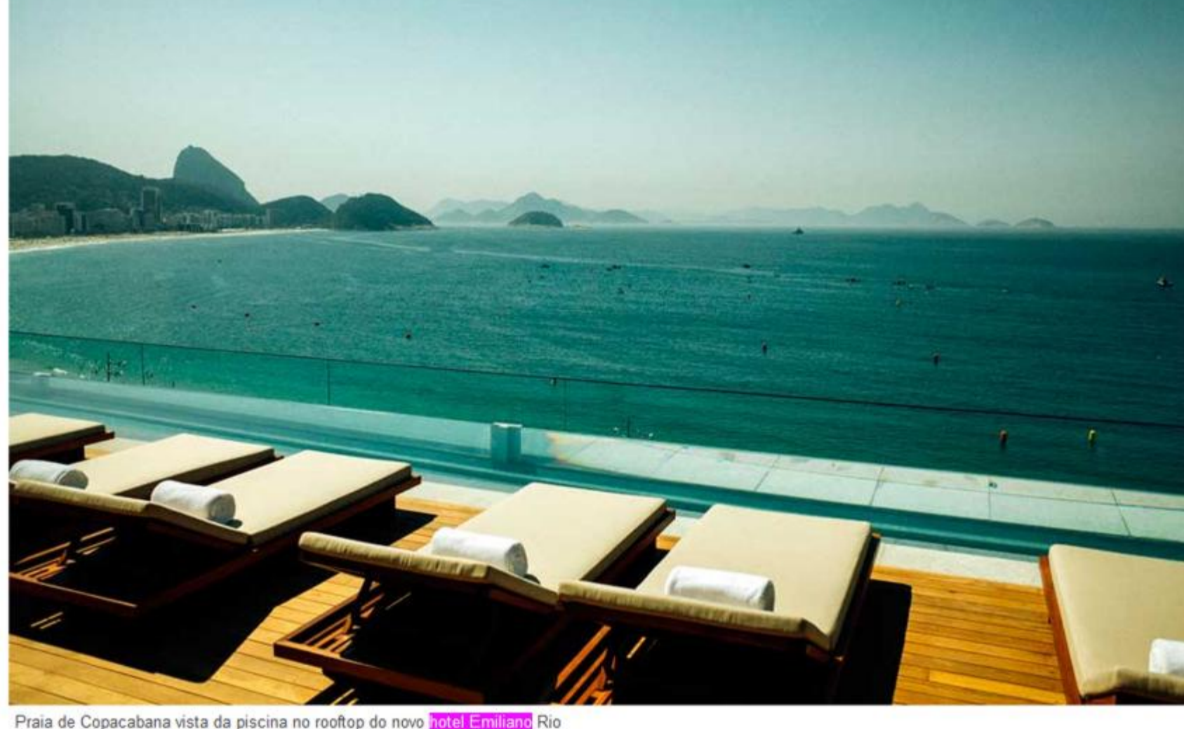
Praia de Copacabana vista da piscina no rooftop do novo hotel Emiliano Rio

Projetado pelos arquitetos Arthur de Mattos Casas e Chad Oppenheim. A fachada de 12 andares oferece vista para o mar da praia de Copacabana. Os 90 quartos exemplificam o modernismo brasileiro, com móveis inspirados no glamour dos anos 1950.